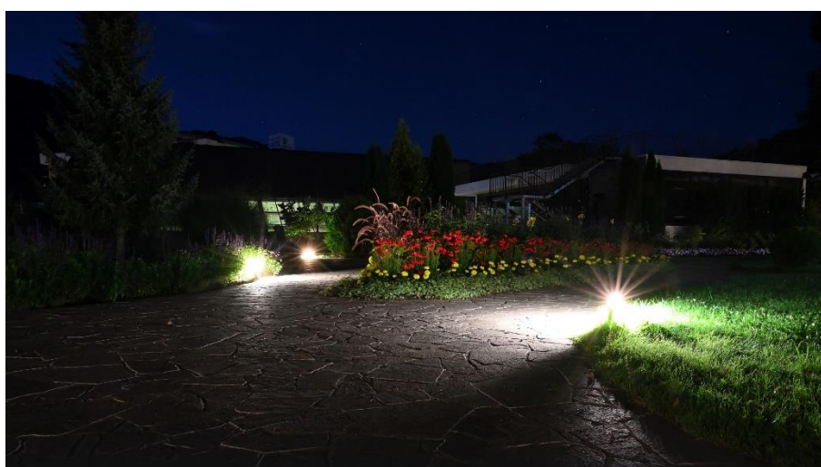
Pametna razsvetljava: v Bohinju, Naklem in Trziču so pomembno prispevali k zmanjšanju prekomernega svetlobnega onesnaževanja.