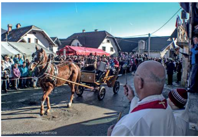
Vaško jedro na Blejski Dobravi